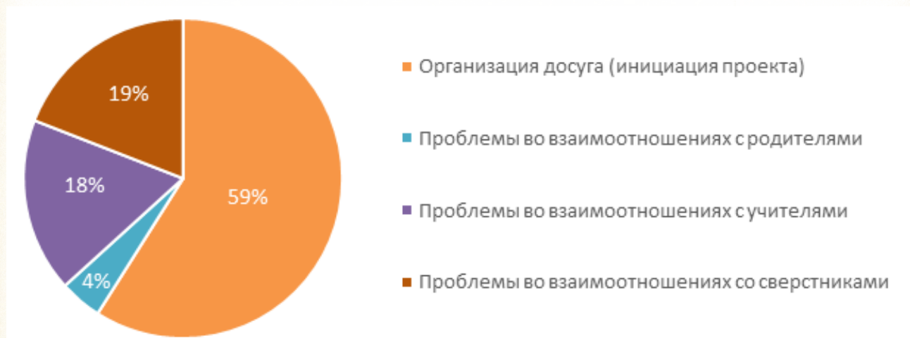
Рисунок 3 Распределение вопросов при обращении к советнику

Распределение ответов на вопрос «С какими вопросами Вы обращались / обратились бы при необходимости к советнику директора по воспитанию» отражено на рисунке 3.