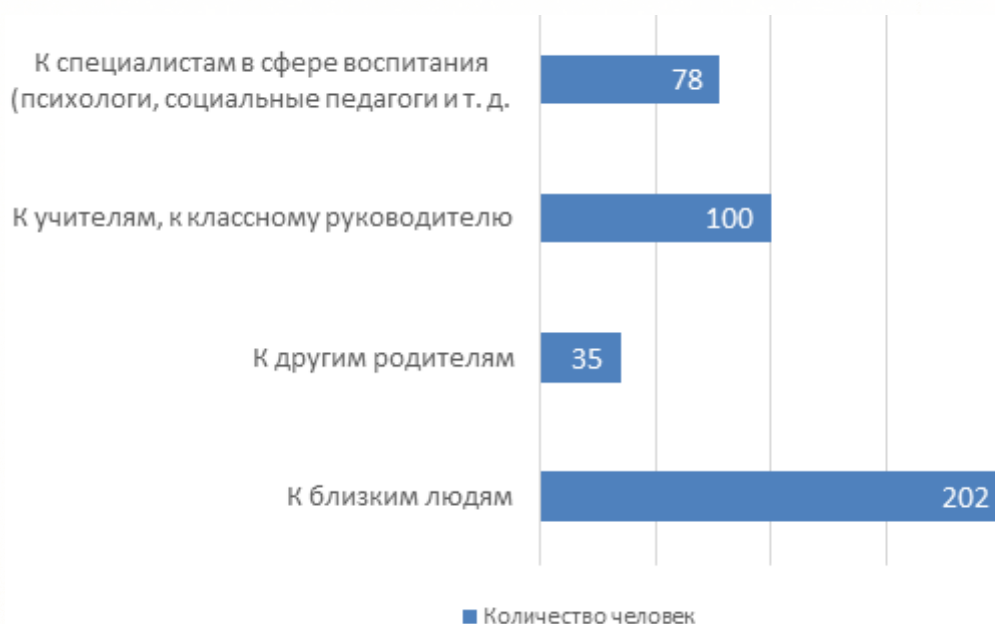
Рисунок 4 Наличие опыта обращения в вопросах воспитания детей за определенной поддержкой извне

Распределение ответов на вопрос «Если у Вас есть опыт обращения в вопросах воспитания детей за определенной поддержкой извне, уточните, пожалуйста, к кому чаще Вы обращаетесь» отражено на рисунке 4.