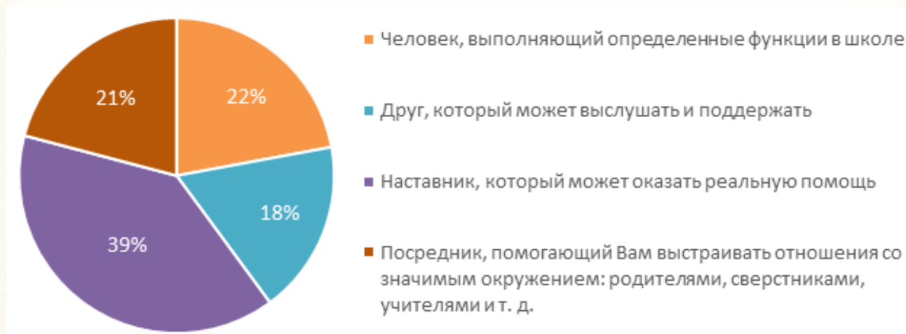
Рисунок 2 Степень осведомленности о роли советника

Распределение ответов на вопрос «Для Вас советник – это прежде всего:» отражено на рисунке 2.