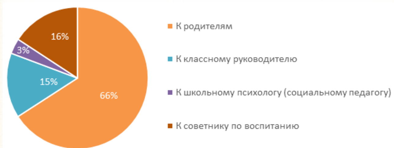
Рисунок 1 Степень доверия к взрослым

Распределение ответов на вопрос «Если бы у Вас возникла какая-то проблема, к кому бы из взрослых в первую очередь Вы обратились?» отражено на рисунке 1.